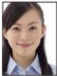
× 頭部蓋到照片邊緣