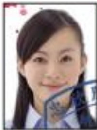
× 戴帽照或印有 鋼印、印章 (使用過)、污損